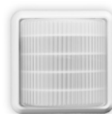
Svítilno IP 110441.01 / SV IP