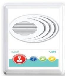
Komunikační jednotka IP 110310.01 / KJ IP