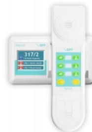
Služební jednotka s displejem IP 110331.01 / SJD IP