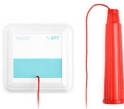
Táhlo nouzového volání IP 110410.02 / TANV IP