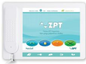
Terminál personálu IP Acrios 110015.02 / TP IP