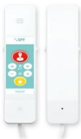
Lůžková jednotka IP 110116.02 / LJ IP