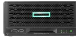
Systémový server VoIP Acrios 110041.01 / SSV IP