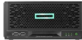
Systémový server VoIP Acrios 110041.01 / SSV IP