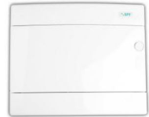
Napáječ 350W 24V IP 110091.01 / N350 IP