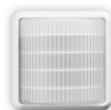
Svítilno IP 110441.01 / SV IP