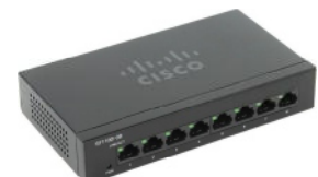
Switch 8 portů 110660.01 / SW