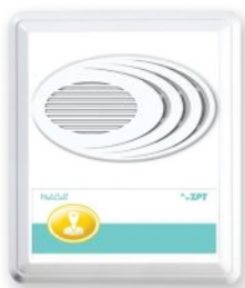
Vchodová komunikační jednotka IP 110281.01 / VKJ IP