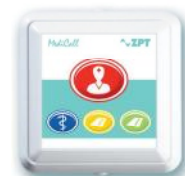
Signalizační jednotka IP 110250.01 / SIJ IP