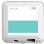
Zásuvka ethernet IP 110030.01 / ZE IP