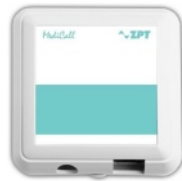
Zásuvka ethernet IP 110030.01 / ZE IP