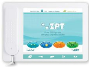
Terminál personálu IP Acrios 110015.02 / TP IP