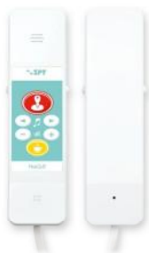
Lůžková jednotka IP 110116.02 / LJ IP