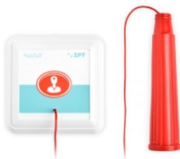
Táhlo nouzového volání s tlačítkem IP 110411.02 / TTNV IP