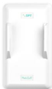
Závěs LJ bez konektoru IP 110131.01 / ZLJ IP