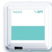
Zásuvka účastníka IP 110190.01 / ZU IP