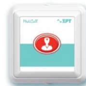
Tlačítko nouzového volání IP 110400.02 / TNV IP