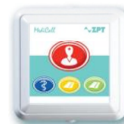
Signalizační jednotka IP 110250.01 / SIJ IP