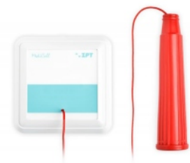
Táhlo nouzového volání IP 110410.02 / TANV IP