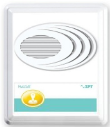
Vchodová komunikační jednotka IP 110281.01 / VKJ IP