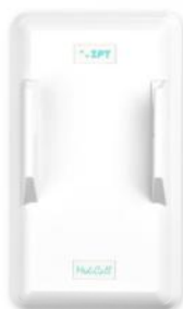
Závěs LJ bez konektoru IP 110131.01 / ZLJ IP