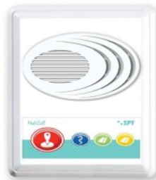
Komunikační jednotka IP 110310.01 / KJ IP