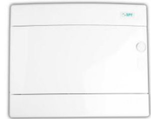
Napáječ 350W 24V IP 110091.01 / N350 IP