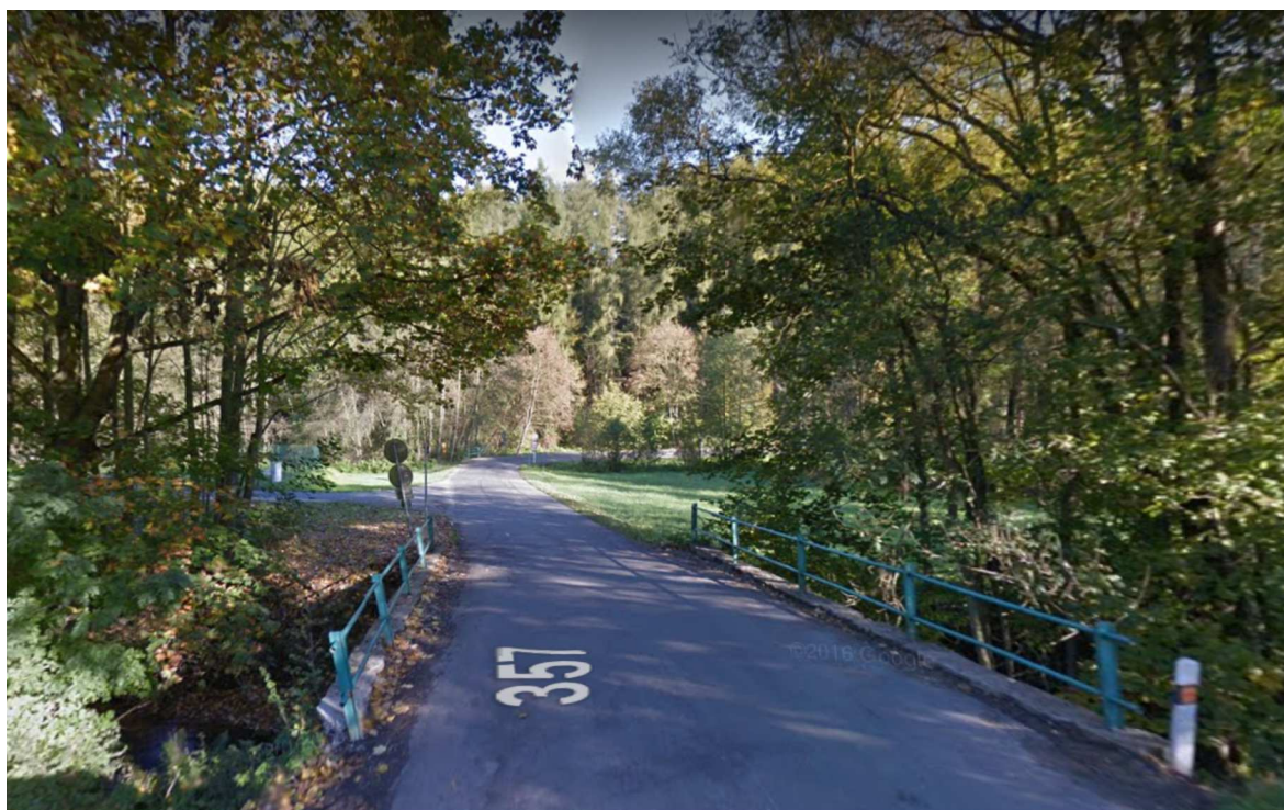
Obr. 1 – Pohled na lokalitu ve vegetaci (10/2011)