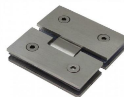
referenční výrobek – závěsný pant provedení – sklo-sklo materiál – leštěná nerezová ocel