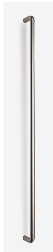
referenční výrobek – madlo materiál – leštěná nerezová ocel

Před zadáním do výroby musí být ověřen skutečný rozměr otvoru a dokumentace případně upravena podle ověřených rozměrů