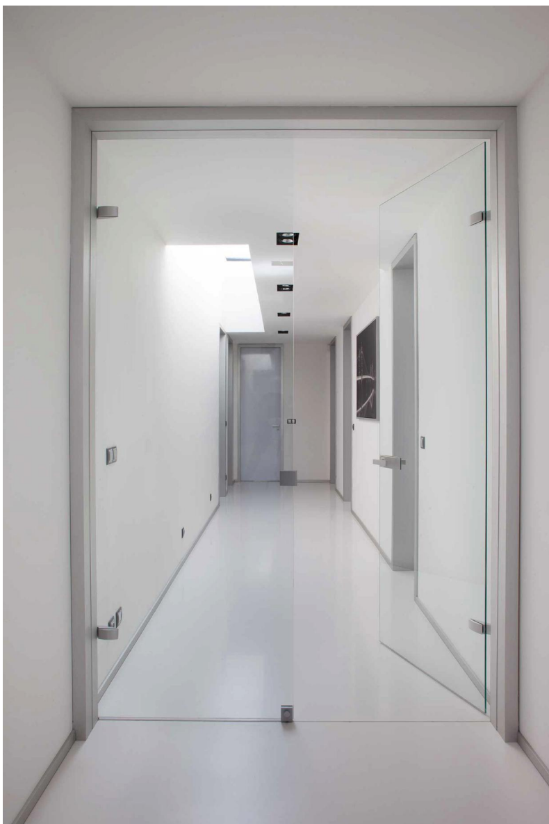
referenční výrobek – skleněné dveře čiré