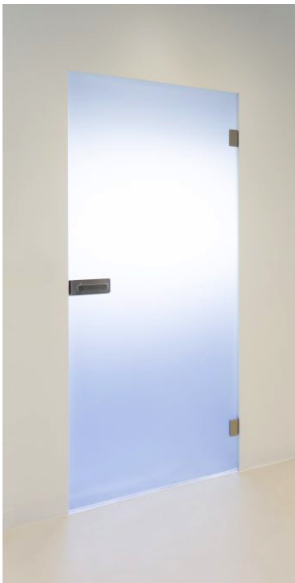
referenční výrobek – skleněné dveře neprůhledné