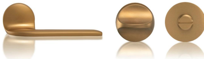
referenční výrobek – klika a wc kování materiál – mosaz povrchová úprava – lesklý chrom