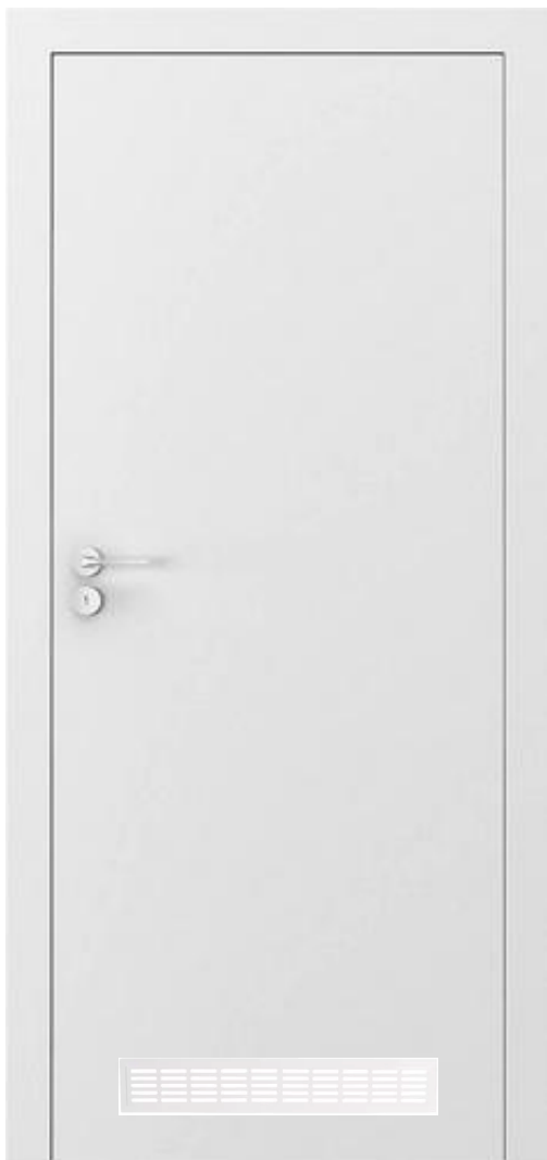
referenční výrobek – obložkové dveře