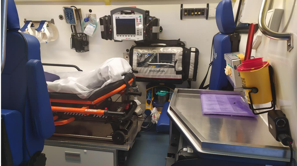
ilustrační foto č. 1