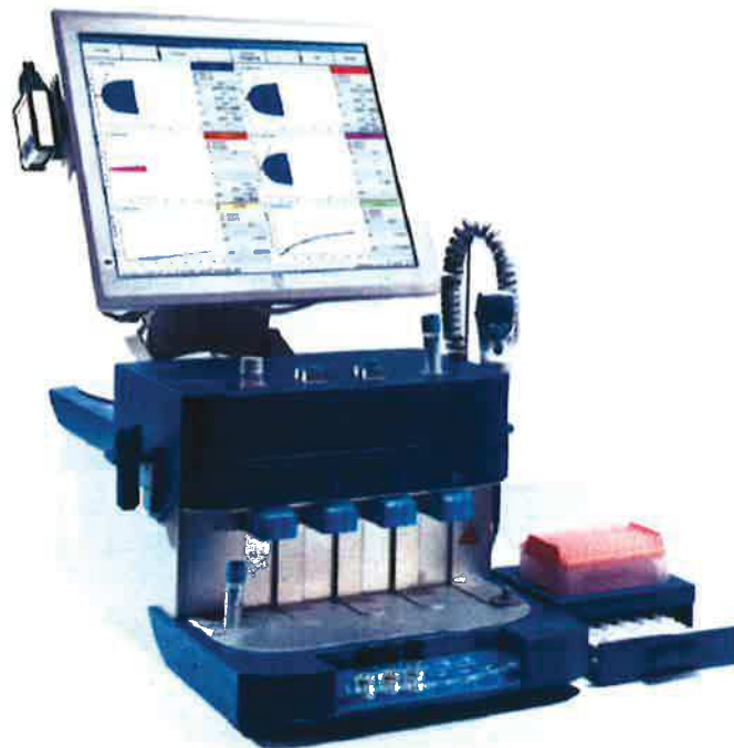
Obr. Tromboelastograf ROTEM ® delta s modulem ROTEM ® platelet