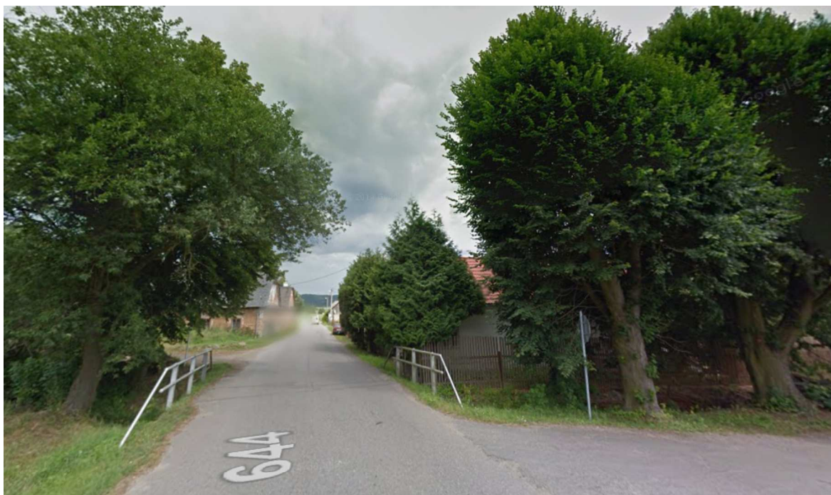
Obr. 1 – Pohled na lokalitu ve vegetaci (06/2011)

Místo stavby most ev. č. 644-003, Pečíkov - Hraničky Objednatel: Bening, s. r. o. Benešov u Semil 7 512 06 Benešov u Semil Zpracovatel: Treewalker, s. r. o. Bystrá nad Jizerou 1 513 01 Semily Zpracoval: David Hora, DiS. Certifikovaný konzultant v oboru arboristika (CČA 0011) tel.: +420 775 224 770 e-mail: david.hora@treewalker.cz sběr dat v terénu: Jan Svárovský, DiS. Datum: leden 2019