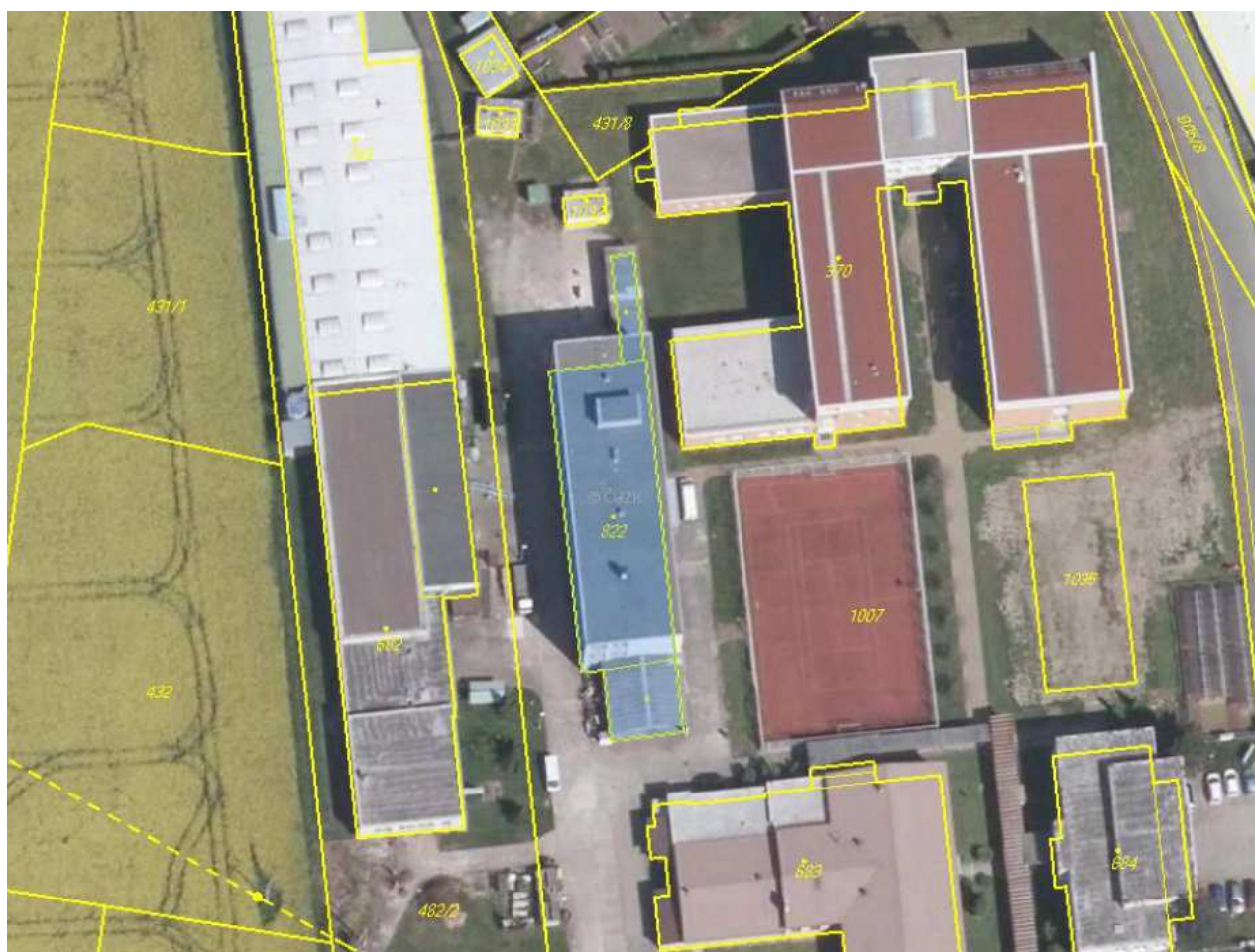
Obr. 2 Katastrální mapa – výřez - ortofoto